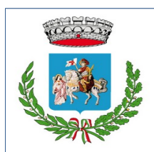
Comune di San Secondo di Pinerolo